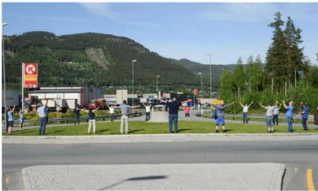
Måndag 31. mai møttest politikarar for å diskutere framtida til Rv7 og Rv52. Gamle stridsøkser vart grave ned, og eit samla Hallingdal vil no kjempe for begge vegane.

I rein frustrasjon på eitregionrådsmøte sa eg til dei andre; når skal me slutte å kjempe innbyrdes om samferdsel i Hallingdal og rette blikket utover å heller stå saman om den verkelege motstandaren? Og med det vart Hallingdalsløysinga fødd. Invitasjon til eit tverrpolitisk samarbeid gav også frukter, Hallingdalsløysinga vart oppskalert til å setja av tid og krefter til eit eige samferdselsutval i Hallingdal og på Hallingtinget rett før sumaren var underteikna valt som leiar! For ein snøballeffekt! Så er det berre å håpe at det synes og betyr noko når hallingan står samla☺