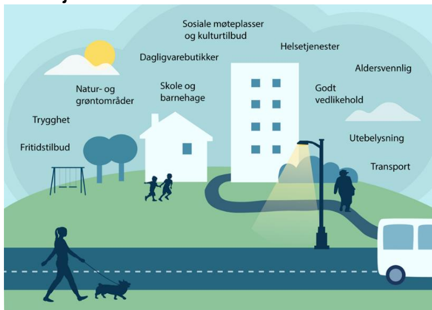
Figur 2. Nærmiljøkvaliteter som har betydning for helse og livskvalitet.

Kjelde: Folkehelseinstituttet (2023). Folkehelseprofil 2023 GOL.