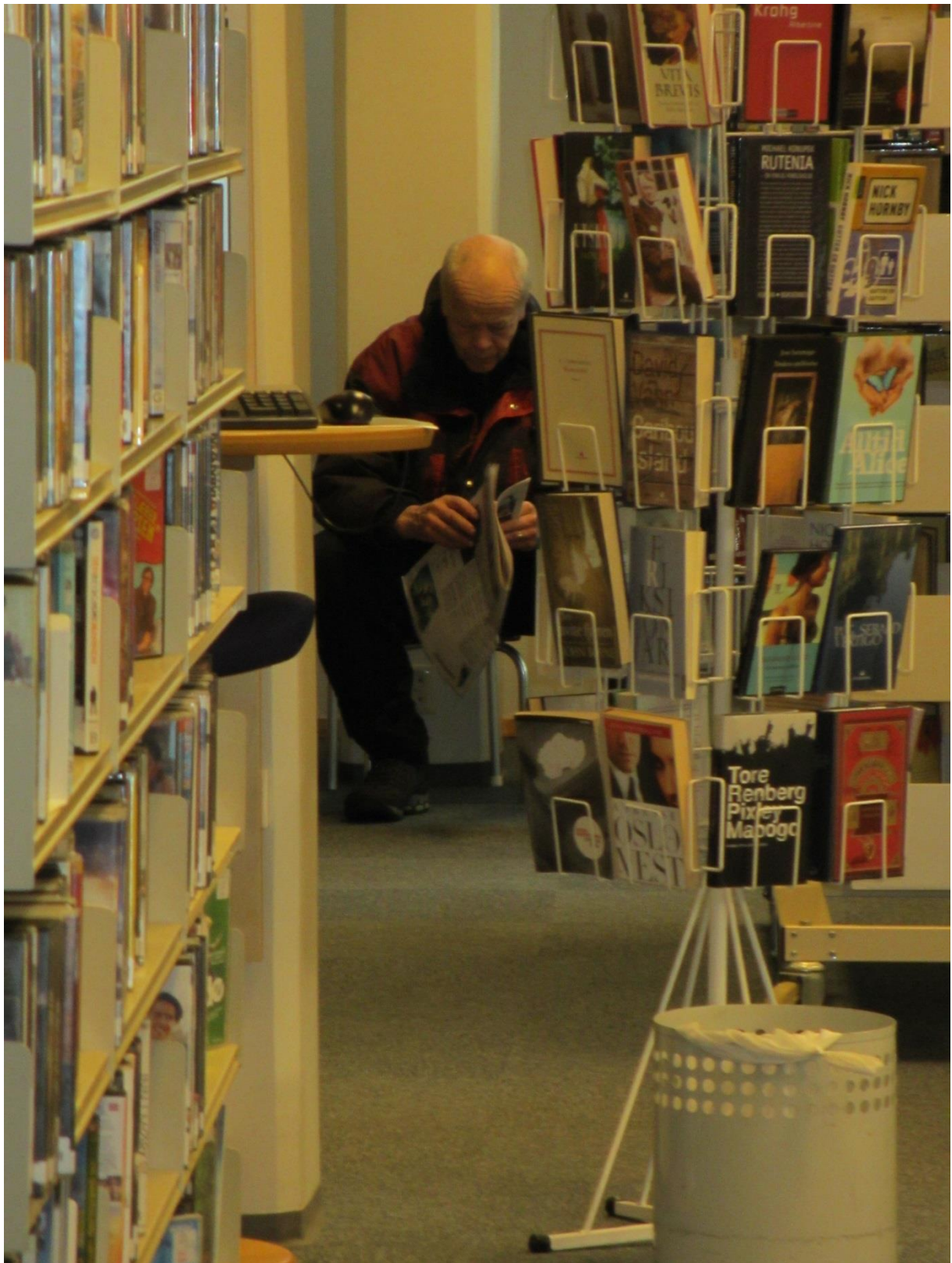
Når elever har tatt alle sitteplasser, kan man ikke være kravstor med avisleseplass