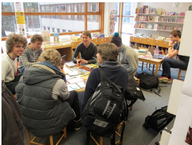
Når det er fullt overalt, da blir barneavdelingen redningen