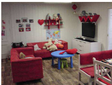
Barnebase Ål statlige mottak

MHVH vil sammen med kommuneoverlegene fortsette å jobbe for gode miljømessige forhold ved asylmottakene, gode helsetjenester og bedre barnehagetilbud for 4- og 5-åringer.