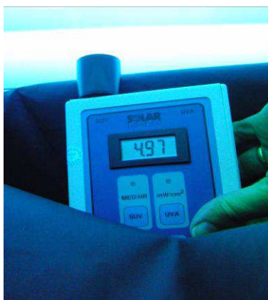
Måling av stråling i solarium

Det var hyggelig å se at ingen av solariene hadde stråling over grenseverdiene satt av strålevernet, men nedslående at bare 7 av 12 virksomheter hadde informasjon/plakat om innført 18-årsgrense. Halvparten av virksomhetene var heller ikke meldt inn til strålevernet, selv om flere av disse har fått pålegg om dette tidligere. De virksomhetene som hadde avvik har fått pålegg om retting. Mange har gitt tilbakemelding om retting, og resten vil bli fulgt opp.