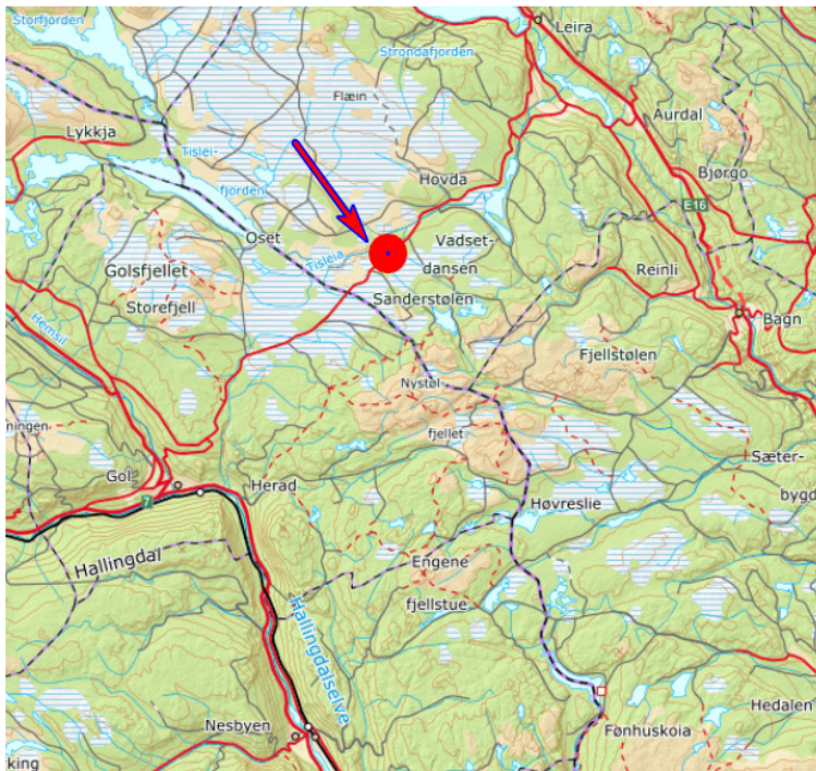
Figur 2: Oversiktskart, planområdet markert med rød.

For mer inngående beskrivelse av planområdet vises det til utarbeidet planbeskrivelse for Lægeret hyttegrend. I dette dokumentet beskrives kun hovedtrekk i forhold til foreslått arealbruk og eksisterende og fremtidig bruk av arealene innenfor planområdet med vekt på forhold som har betydning ROS vurderinger i saken.