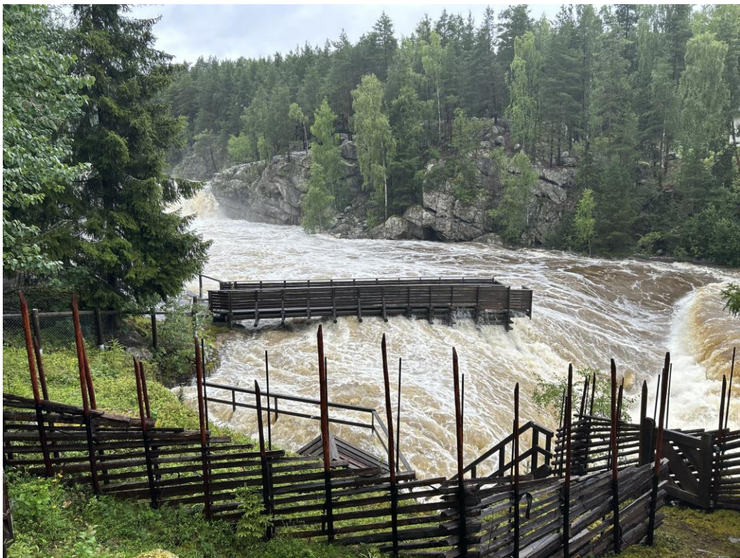
Bilde er av Hemsil ved Myklefossen kraftstasjon 08.08.23 kl. 18:00.